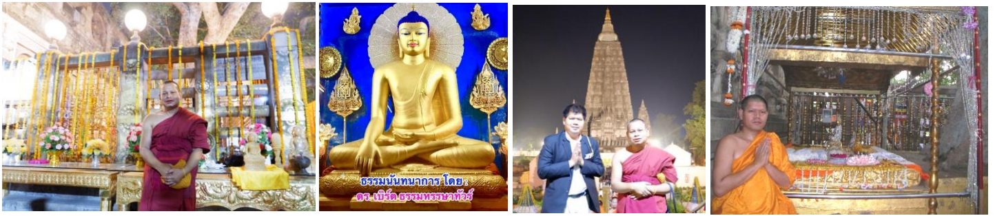
ต้นพระศรีมหาโพธิ์ : สถานที่ตรัสรู้ พระพุทธเมตตา พระมหาเจดีย์พุทธคยา พระแทนวัชรอาสน์ โพธิบัลลังก์

14.00 น.-เดินทางสู่ “โพธิมณฑล” +สวดมนต์เจริญสมาธิภาวนา ณ (1) ต้นพระศรีมหาโพธิ์ สถานที่ตรัสรู้ของพระพุทธเจ้า