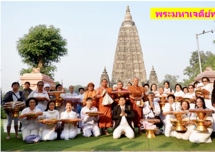
พระมหาเจดีย์พุทธคยา ดันพระศรีมหาโพธิ์ สถานที่ตรัสรู้

กลิ่นอินเดีย BB : โปรแกรมพิเศษ ! ปฏิบัติธรรม ณ ดันพระศรีมหาโพธิ์ (7 คืน/8 วัน) สังเวชนียสถาน 1 ตำบลที่ตรัสรู้+พุทธสถาน 2 แห่ง : เน้นปฏิบัติธรรม ณ ดันพระศรีมหาโพธิ์ (1) พุทธคยา ดันพระศรีมหาโพธิ์ สถานที่ตรัสรู้ พระมหาเจดีย์พุทธคยา พระพุทธเมตตา (2) ราชคฤห์ เขาคิชฌกูฏ วัดเวฬุวันแห่งแรกของโลก ตโปธาราม อนุสรณ์อาบน้ำวรรณะ 4 (3) นาลันทา บ้านเกิดพระสารีบุตร-พระมหาโมคคัลลานะ มหาวิทยาลัยนาลันทา หลวงพ่อดำ