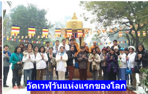
วัดเวฬุวันแห่งแรกของโลก