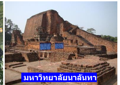
มหาวิทยาลัยนาลันทา

2 พ.ย. 62-22 มี.ค. 63 : FD บินตรงไป-กลับ พุทธคยา : 19,900.- บาท